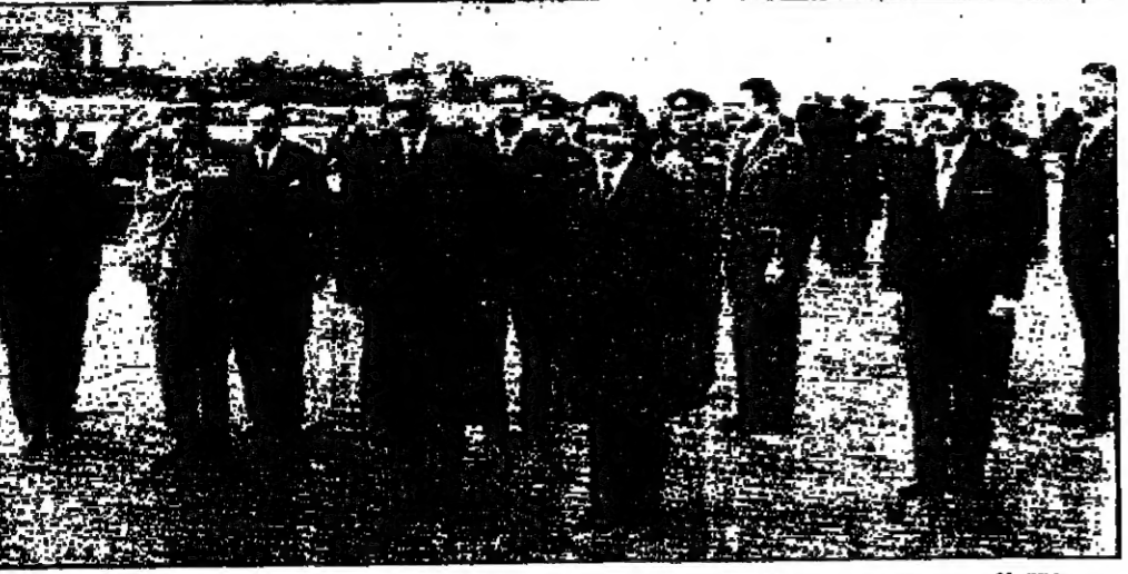
جلالة الحسين والرئيس عبد الناصر في وقت انشاء بطار القاهرة خلال عزف السلامين الملكي الاردني والجمهري المصري